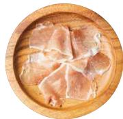
パルマ産 プロシュート PROSHOOT これぞ王道生ハム! 640