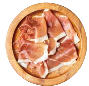
スベック SPEC 表面を燻製したハム 540