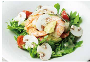
天然海老とアヴォカド、 マッシュルームのサラダ SHRIMP & AVOCADO WITH MUSHROOM SALAD 1050