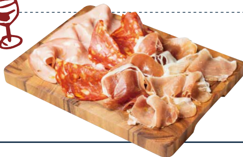
生ハムとサラミの盛り合わせ 1250 AFFETTATS 4種のサラミの盛り合わせ!アテにぴったり