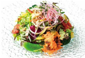
旬野菜のサラダ SEASONAL VEGETABLE SALAD 1050