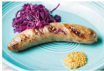
スパイスを練り込んだ ソーセージのグリル GRILLED SPICE SAUSAGE 620