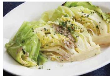
アンチョビバターと キャベツの窯焼き 730 ANCHOVY BUTTER & CABBAGE SKEWERS