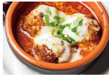
仔羊のポルペッティ モッツァレラチーズの ココット焼き(ミートボール) LAMB'S PORPETTI & MOZZARELLA COCOT BAKED 910