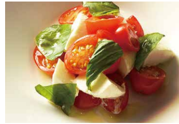
水牛モッツァレラの カプレーゼ 1050 BUFFALO MOZZARELLA & TOMATO CAPRESE